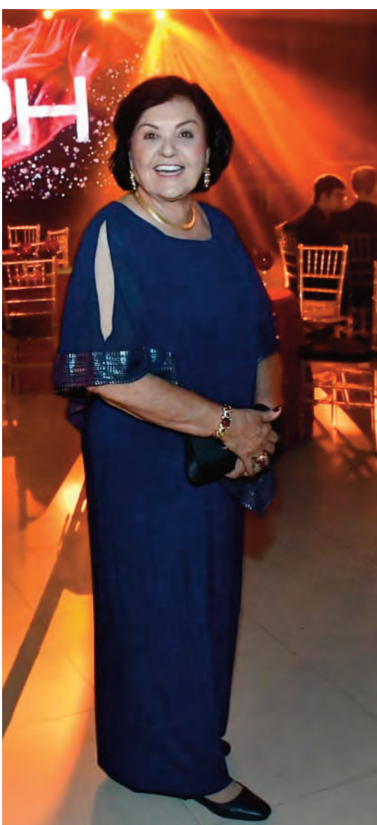
Ex-primeira dama do Estado, Zenira Massoli Fiquene