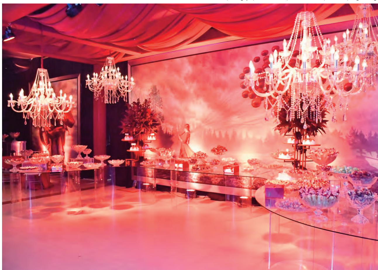
A mesa de doces decorada pela designer Cintia Klamt Motta parecia uma cena de filme